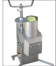
KG-453 Die leistungsstarken Gemüseschneider von Kronen

Gemüseschneider. Reiben, raspeln, schneiden. Vom Tischmodell bis zur Standmaschine.