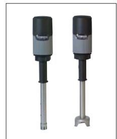
EMA Stab 55 und Stabmixer Für Früchte, Cremes, Eismassen

Mixen und rühren. Vom 4 l-Tischmixer über Handmixer bis zum Turbomixer.