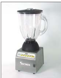
KM-4 Die neuen Gewerbemixer von Kronen

Mixen und rühren. Vom 4 l-Tischmixer über Handmixer bis zum Turbomixer.