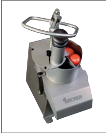
KG-201 Der neue Gemüseschneider von Kronen

Weitere Maschinen für Pâtisserie, Konditorei, Restaurant und Bar: