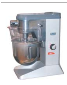
BE 5 Professionelles Kompaktgerät mit 5 l Kesselinhalt

Planetenrührer. Vom 5 l-Modell bis 80 l mit Heizung, Schaber, Wagen usw.