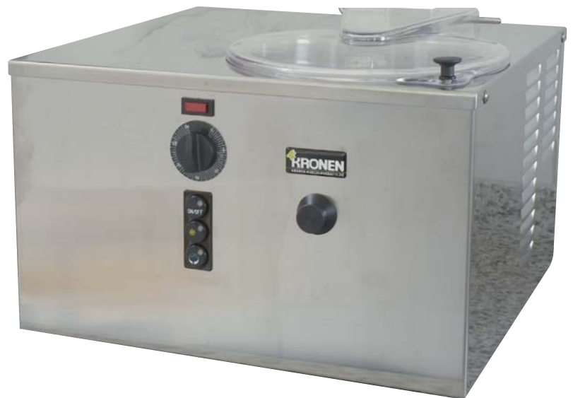
Modell G 10