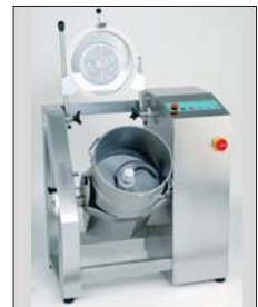
CutStar 40 I Mit 2 Geschwindig- keiten oder stufenlos

Cutter. Vom 2 l-Modell mit 1 Geschwindigkeit bis zum Proficutter mit 40 l.