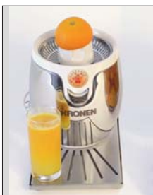
KP-3 Die kleinste der Kronen Saftpresen

Maschinen für frische Säfte. Vom Handgerät bis zur vollautomatischen Maschine.