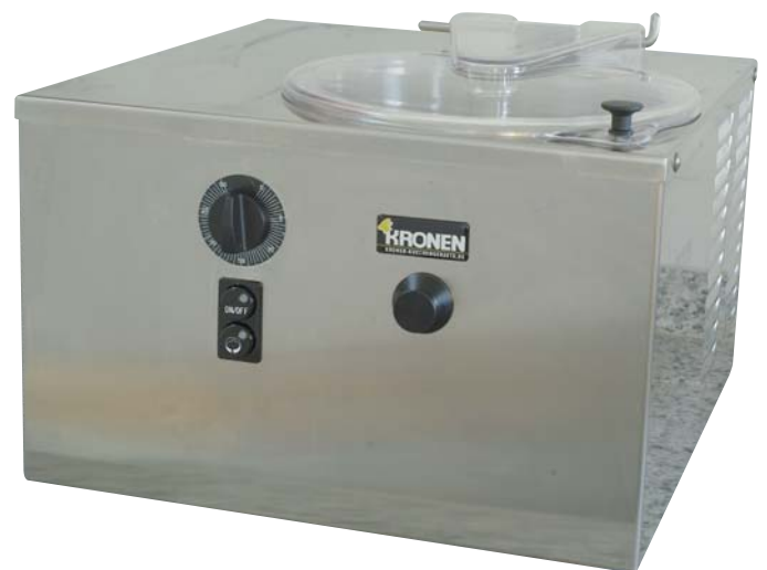
Modell G 5

Alarmlampe für Entnahme bei nicht korrekter Produkttemperatur (nur bei Mod. G 10).