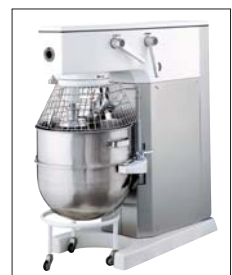
Planetenrührwerk KP-60 mit 60 l Fassungs- vermögen

Planetenrührer. Vom 5 l-Modell bis 80 l mit Heizung, Schaber, Wagen usw.