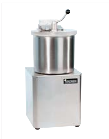
Nako Cutter 5 I Kronen Cutter mit Pulsschaltung

Cutter. Vom 2 l-Modell mit 1 Geschwindigkeit bis zum Proficutter mit 40 l.