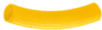
N.105 - 11 mm 27 Rillen