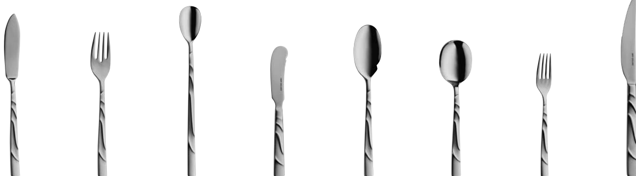
.1140 Fischmesser Fish knife 208 mm · 8 3 / 16 in.